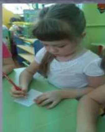
Изготовление книжек “Береги природу”.